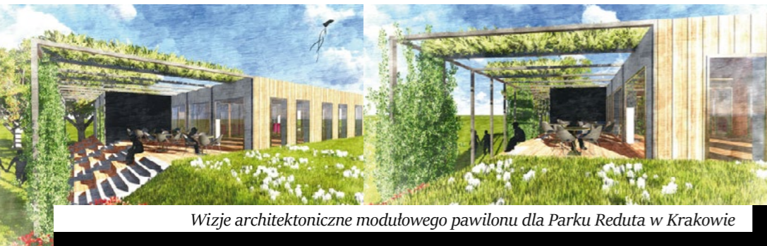
Wizje architektoniczne modułowego pawilonu dla Parku Reduta w Krakowie

Celem projektu jest uzupełnienie „braku”, poprzez lokalizację atrakcyjnego obiektu pawilonu, którego układ funkcjonalno-przestrzenny pozwoli na realizację różnorodnego programu wspierającego integrację mieszkańców dzielnicy. Utworzenie takiego miejsca stanowić będzie swoiste centrum nowo powstającego parku Reduta, a także jedyny w swoim rodzaju katalizator społecznej aktywności, dedykowany lokalnej społeczności. Nowo-projektowany parterowy budynek pawilonu, liczący 245 m 2 powierzchni, obejmuje m.in. wielofunkcyjne otwarte pomieszczenie z bufetem i zapleczem, pomieszczenie biurowe, zespół pomieszczeń sanitarnych (w tym pomieszczenie matki z dzieckiem).