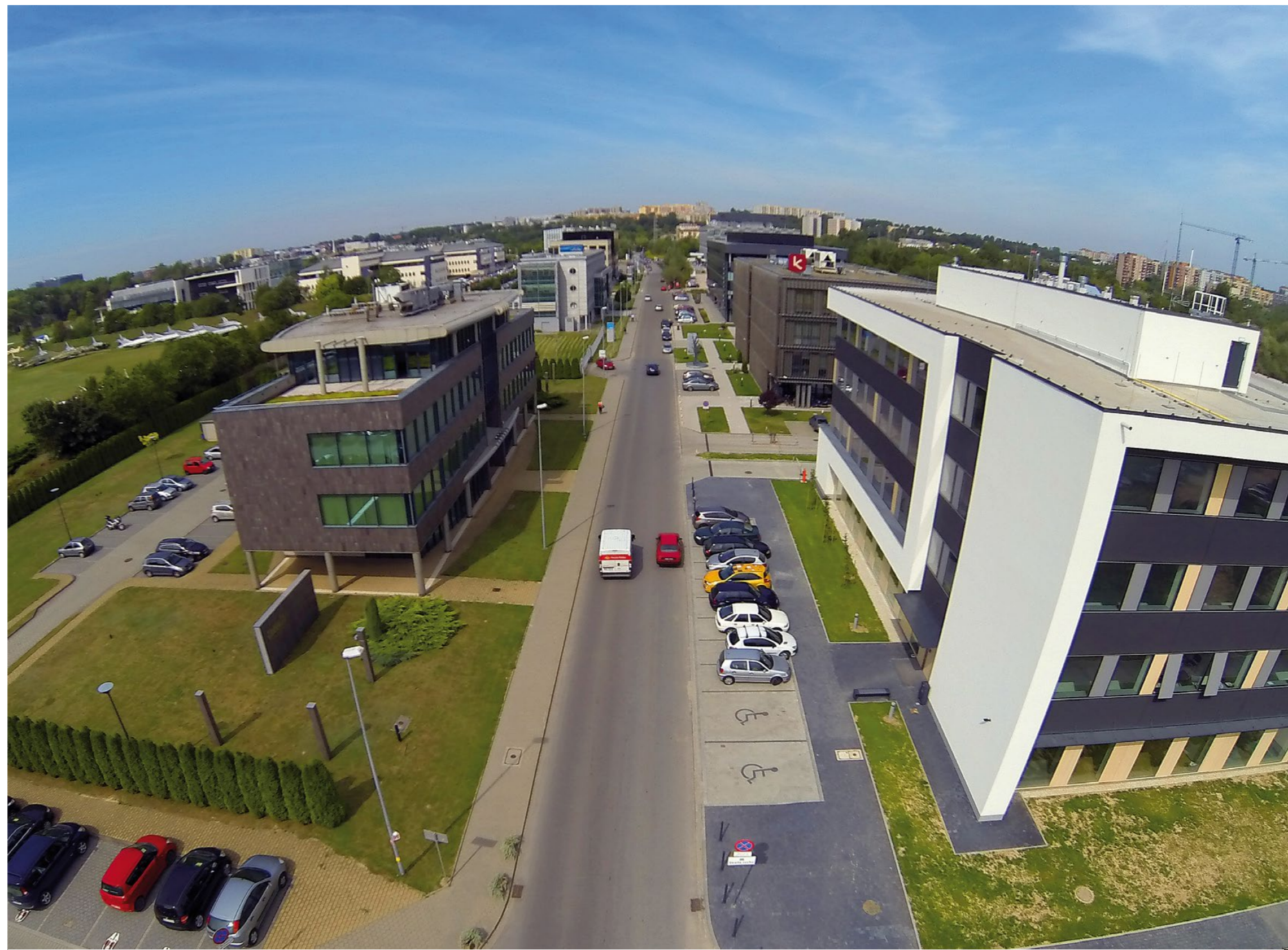
Podstrefa krakowskiej sse w Czyżynach

w światowej gospodarce, także mechanizm jakim są strefy powinien podlegać rozwojowi. Spółki zarządzające muszą poszerzać swoją ofertę dla firm i stawiać się instytucjami wsparcia biznesu świadczącymi nowoczesne, szyte na miarę usługi. Strefy 2.0 to dzisiaj już nie jest zakłęcie mówiące o dążeniu do rozwoju, to po prostu cywilizacyjna konieczność.