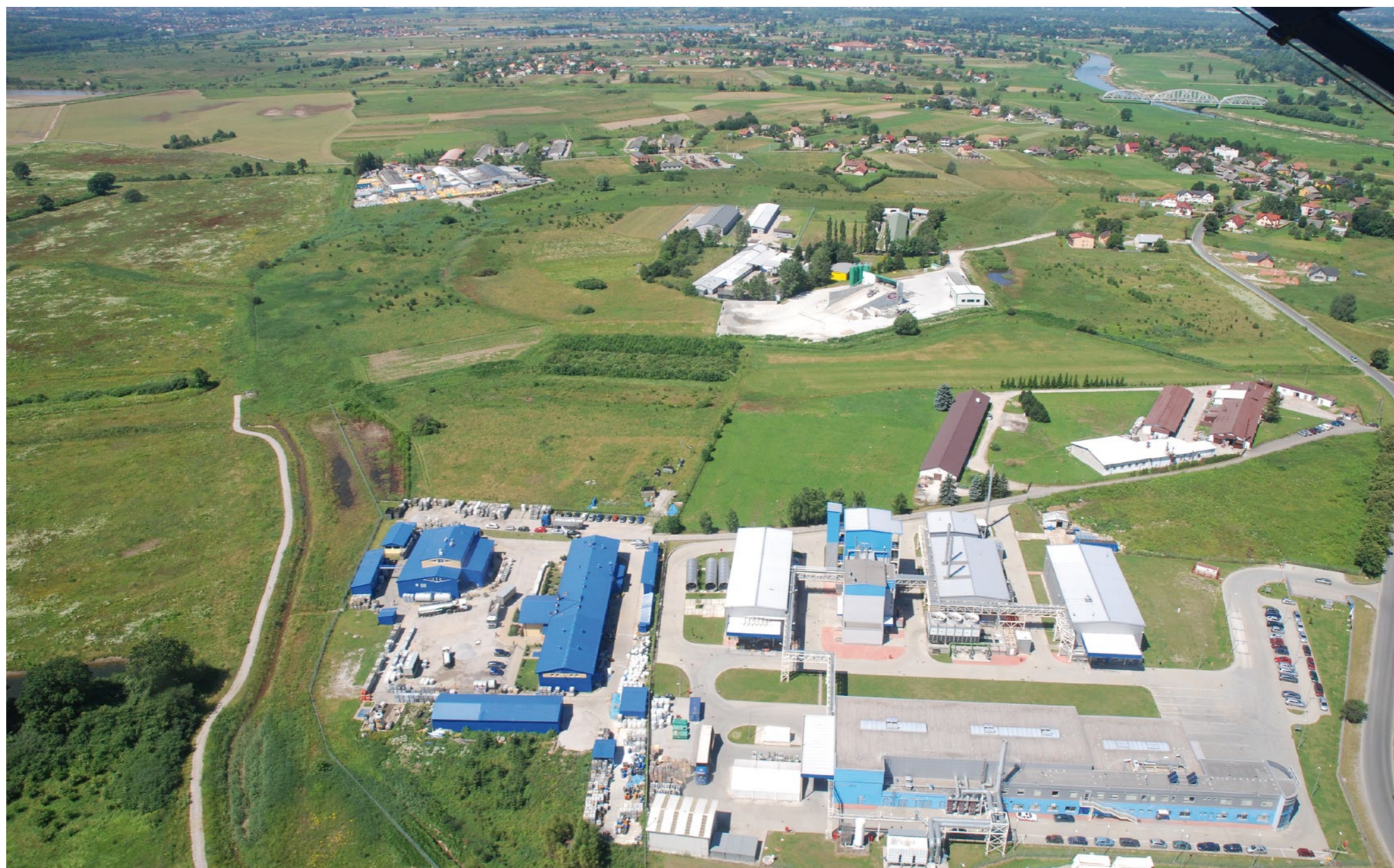
Podstrefa krakowskiej sse w Niepołomicach