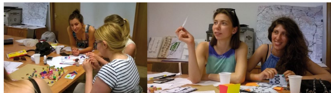
Szkolenia z Agile Project Management, elastycznych sposobów zarządzania pracą wymagających silnej współpracy z klientem. Stosowanie APM zapewnia, że końcowe rozwiązanie zaspokaja potrzeby klienta, a nie tylko potrzeby zespołu realizującego projekt. Zdjęcie uczestników ze szkoleń z lipca 2016.