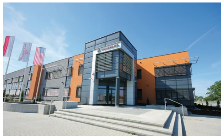
Woodward Poland Sp. z o.o. w krakowskiej sse w Niepołomicach

Rywalizacja poszczególnych państw na tej płaszczyźnie uległa zdecydowanemu zaostreniu. Działania te są jednocześnie coraz lepiej skoordynowane i ukierunkowane na konkretne grupy inwestorów.